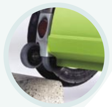
Dubbele anti-tip wielen voor stabiliteit en het nemen van stoepen