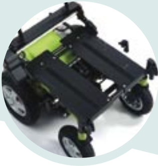
Breedte en diepte instelbare basis van het systeem