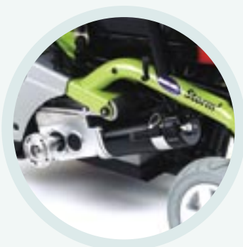
Heavy duty motoren voor 30% meer vermogen