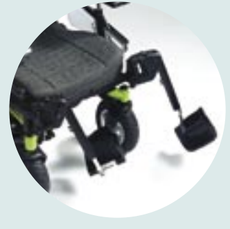
In hoek instelbare beensteunen, naar binnen en buiten wegzwenkbaar