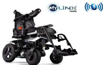
La configurazione più variare dall'immagine

Nome & Cognome _____ indirizzo _____ email _____ num telefono _____