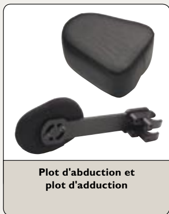
Plot d'abduction et plot d'adduction