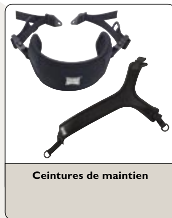
Ceintures de maintien