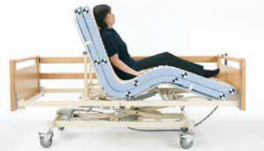
Opties / Options