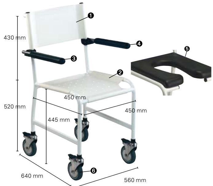
Invacare Revato R7710,073 / R7711,073

Douchestoel in Rilsan staal en inox vijzen voor hoge bescherming tegen corrosie / Chaise de douche en acier rilsané et visserie inox pour une très haute résistance contre la corrosion