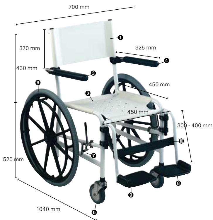
Invacare Revato R7722,073

Verrijdbare douchestoel in Rilsan staal en inox vijzen / Fauteuil roulant de douche en acier rilsané et visserie en inox.