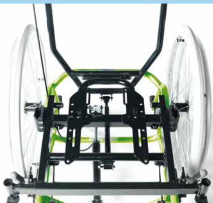
Opties / Options

La position de l'unité d'assise est inclinable et dispose maintenant d'un plus grand rayon d'action. L'inclinaison peut être ajustée à l'aide d'une vis de serrage ou d'un levier de pression. Les barres de l'unité d'assise ont été arrondies afin de faciliter le montage. La largeur est ajustable à partir des accoudoirs et des repose-jambes, et la hauteur du siège peut être réglée grâce au châssis télescopique.