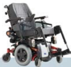
Invacare® TDX SP