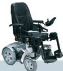
Invacare® Storm 4 och Storm 4 X-plore