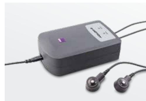
Automatische acculader: Automatische aanpassing naar ieder gangbaar voltage. Laadt beide e-motion wielen in slechts een paar uur op (onderdeel van de levering)