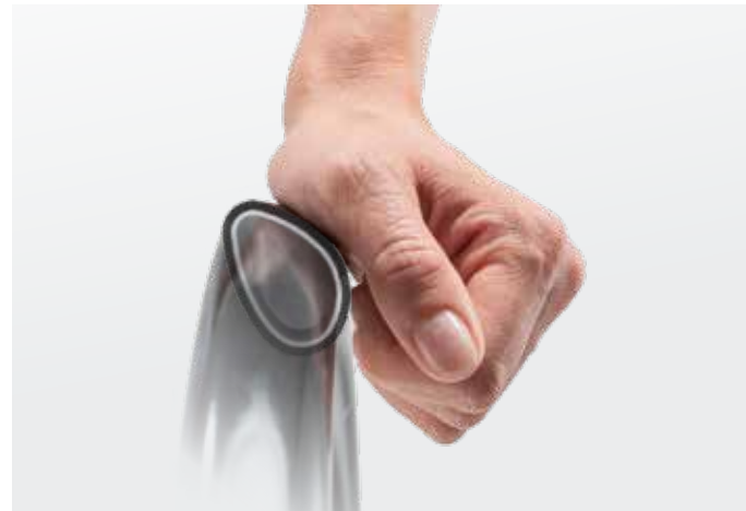
Gecoate Quadro hoepel: controle en krachttransmissie met een beperkte handfunctie