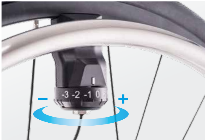
Gevoeligheid van de hoepelsensor kan in zeven standen worden ingesteld

De e-motion is flexibel: het past op bijna alle handbewogen rolstoelen en kan worden aangepast aan jouw wensen. De gevoeligheid van de hoepel sensor kan op beide wielen afzonderlijk worden ingesteld. Dus meer of minder kracht in één arm is geen probleem. Je dealer of ergotherapeut heeft ook de mogelijkheid om verdere aanpassingen aan je e-motion te doen zodat deze optimaal is ingesteld om aan jouw behoefte en rijstijl te voldoen. De e-motion is verkrijgbaar in drie wielmaten en kan op aanvraag worden uitgerust met ergonomische hoepels. Dit zorgt voor optimale grip in iedere rij situatie.