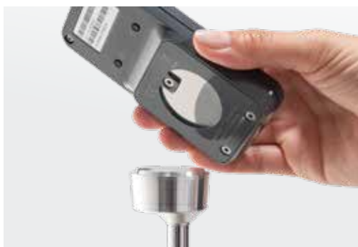
Magnetische houder voor ECS bediening voor op de rolstoel (accessoire)