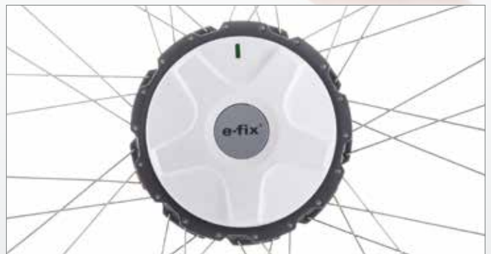
Compact, stil en krachtig: de e-fix rijwielen