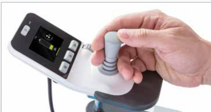
Informatief kleuren display met gebruiksvriendelijke bedieningen