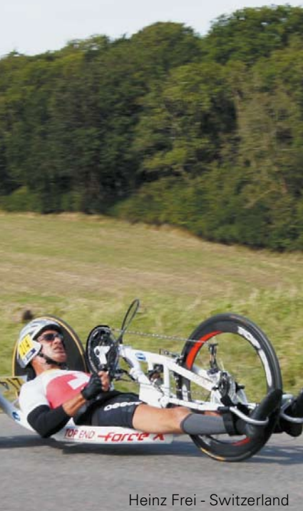
Heinz Frei - Switzerland

Het hoofdframe is gemaakt van 7005 aluminium dat geheel op maat wordt gebogen met aluminium buizen met een ovaal profiel, zodat de bike super stijf is voor maximale kracht. Het design van de Force R handbike is snel, stabiel en lichter dan ooit. Bovendien is het ongeëvenaarde aerodynamische ontwerp van de Force R instelbaar in liggende of half-liggende positie dankzij de eenvoudig in te stellen rug en crank. Deze instellingsmogelijkheid en de nieuwe, lichtere mesh bekleding zorgen voor een optimaal comfort waarbij vooral de arm-, schouder, en borstspieren worden gebruikt.