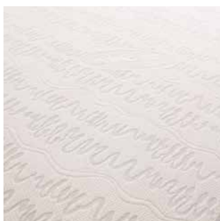
Witte katoenen hoes.

Optioneel waterafstotende binnenhoes verkrijgbaar.