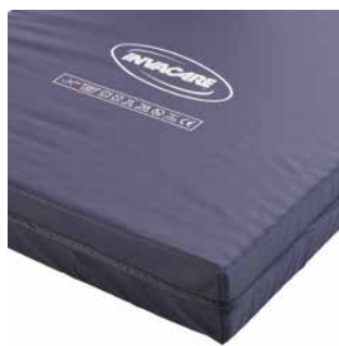
Blauwe, vochtafstotende hoes.