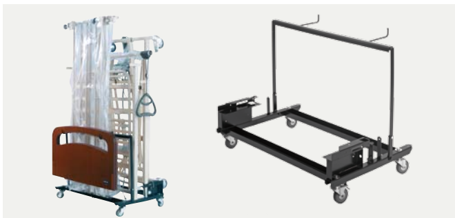
Transportset Een transportset voor eenvoudig transport en ruimtebesparende opslag.