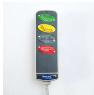
Handbediening De bedden worden geleverd met een "Dewert"-handbediening met "groene knop"-functie. Ook verkrijgbaar in een versie waarbij elke functie individueel geblokkeerd kan worden.