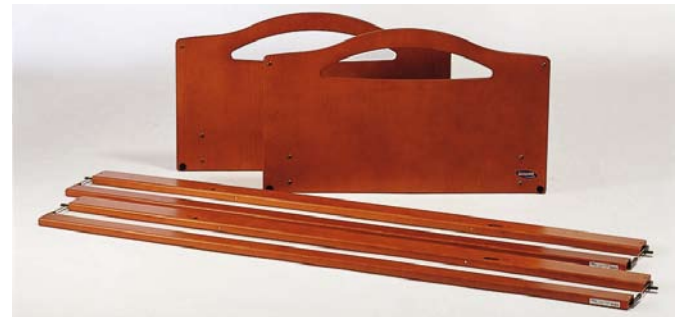
Hoofd- en voeteneinde Kirsty en houten onrusthekken Nina (kersen, ook in beuken verkrijgbaar).