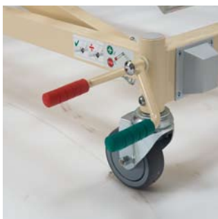
Centrale beremming Verkrijgbaar met een wieldoorsnede van 100 mm of 125 mm.