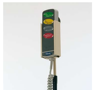
Houder handbediening Een flexibele houder voor de handbediening zorgt ervoor dat de handbediening eenvoudig bereikbaar is.