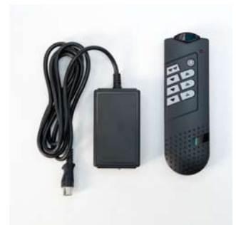
Infrarood handbediening Een infrarood bediening met ingebouwde ontvanger zorgt voor een draadloze bediening.