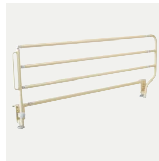
Verso onrusthek Inklapbaar metalen onrusthek