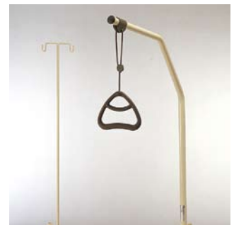
Papegai en infuushouder Papegai kan zowel in hoogte als in diepte vestelbaar.