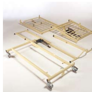
Eenvoudig te monteren Het bed kan eenvoudig worden gemonteerd en gedemonteerd door slechts één persoon.