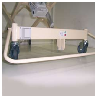
Centrale beremming Centrale beremming door middel van een bedieningsboog onder het voeteneind.