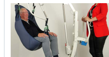
Sangle avec clips IQ sécurisés.