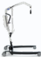
Birdie EVO COMPACT

▶ Kleinere frame voor manoeuvreren in kleine ruimtes