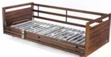
▶ Invacare® NordBed Optimo ▶ Invacare® NordBed Ultra