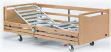
▶ Invacare® SB 755