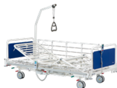
▶ Invacare® SB 910