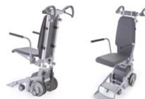
ScalaMobil equipado com Scalachair X3