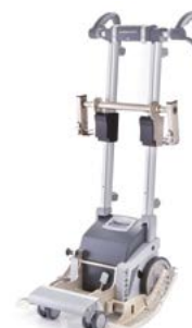
1521111 + 1520414