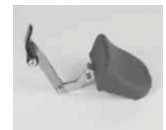
0578 / 0579