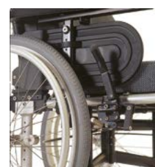
0990 / 1000