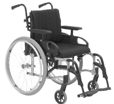
De getoonde productfoto kan afwijken van de standaardconfiguratie