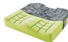
Matrix Flo-tech Image