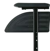
0482 / 0512