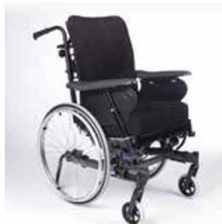
Rea Dahlia 45