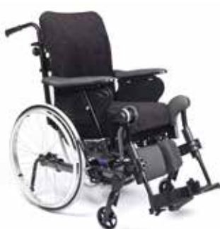
Rea Dahlia 30