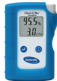
Check O2 Plus zuurstof- concentratie meter