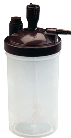
Luchtbevochtiger Platinum® 9