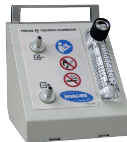
Paediatric Flowmeter - 50 to 750 cc/min