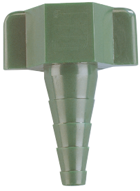
Verbindingsstuk zuurstoftank universeel