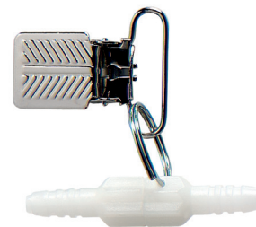
Draaibaar verbindingsstuk met klem voor kwetsbare huid