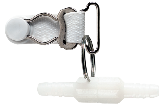
Draaibaar verbindings- stuk met klem voor kwetsbare huid