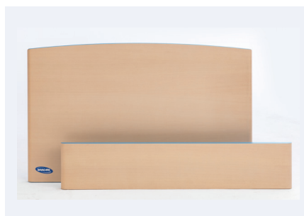
Una / Una Low

Kan in combinatie met volle lengte zijhekken, gedeelde zijhekken of zijpanelen