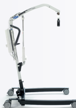
Birdie EVO COMPACT

Een opnieuw ontworpen versie van de marktleidende Birdie tillift, ontworpen om veilige transfers te ondersteunen in zowel de thuiszorg als in de zorginstelling.