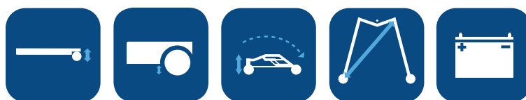
Hoogte poten ▼ Bodemvrijheid ▼ Hoogte indien opgevouwen ▼ Draaicirkel ▼ *Werkvermogen ▼