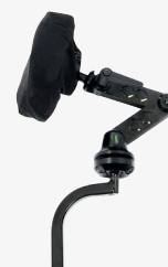
Invacare Matrx* Elan hoved-og nakkestøtter