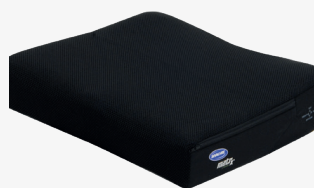
Invacare Matrx* Libra