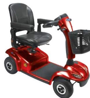
Leo 4-wiel uitvoering