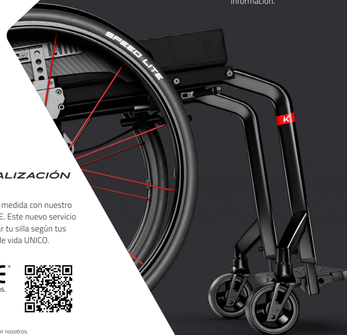
Foto: Ruedas Spinergy con características ÚNICAS. Escánea el código QR para más información.

* Diseñado por ti. Construido por nosotros.