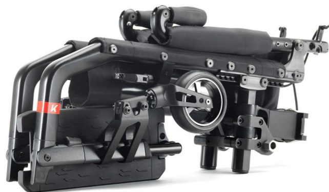
Küschall Champion SK

Facile à manipuler pour le transport et le rangement grâce à son mécanisme de pliage en un seul geste, son dossier rabattable et ses roues arrière à démontage rapide. Optez pour la version "SK3 (Swiss Knife = couteau suisse) dotée d'un châssis avant rabattable pour obtenir un modèle Champion ultra-compact.