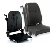
Dossier: ASA 2172 bzw. 2173