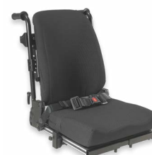
Dossier: ASA 2174, 2175