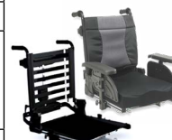
Dossier: ASA 2171