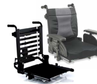
Dossier : AVA 2171