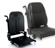
Dossier : AVA 2172 ou 2173