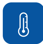
Maksimal vasketemperatur ▼