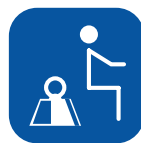
Maksimal brukervekt ▼