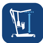
Løfteområdet med kort og lang innstilling av løftebom ▼