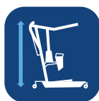
Høyde med bom i lav/høy innstilling ▼