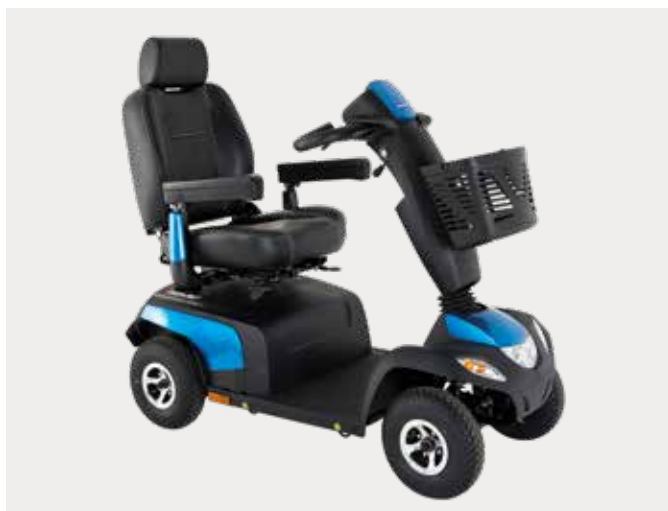
4-hjulet Orion PRO