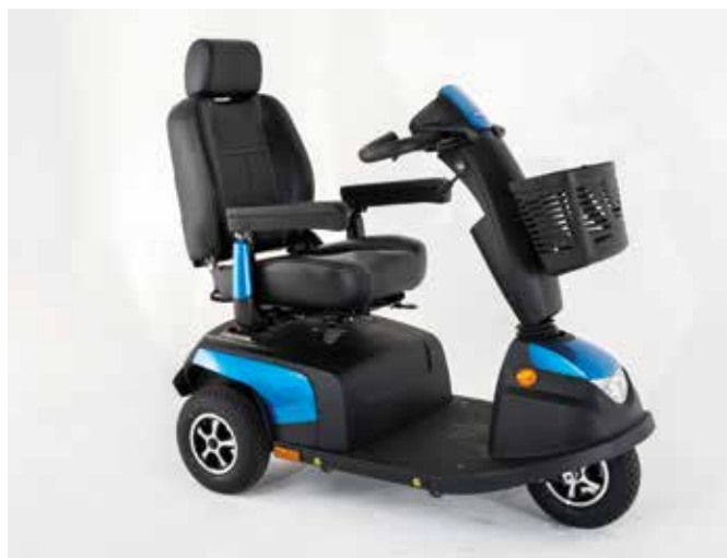
3-hjulet Orion PRO