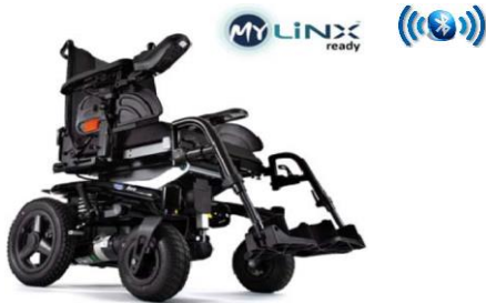
La configurazione più variare dall'immagine

Nome & Cognome _____ indirizzo _____ email _____ num telefono _____