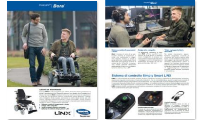
Codici N.T. (configurazione standard):