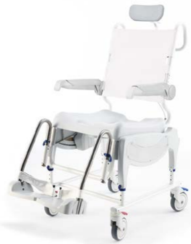
Ocean VIP Ergo

Ontdek onze meest geavanceerde douche-/toiletstoelen met zitkantelverstelling met de nieuwste doorontwikkelingen. De Ocean VIP Ergo en de Ocean Dual VIP Ergo zijn uiterst configureerbaar en modulair. Zij bieden oplossingen met een hoog niveau van comfort en ondersteuning voor in de badkamer.