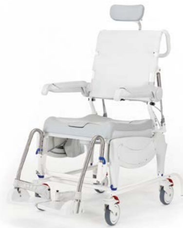
Ocean Dual VIP Ergo

Een geavanceerd model met zitkantelverstelling van -5° tot 40°.