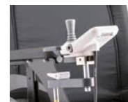
Wegzwenkbare joystick bediening