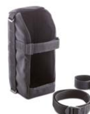
Transporttas en bevestiging