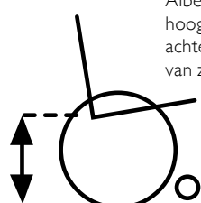
Alber inbouwhoogte: hoogte, gemeten aan achterzijde, onderkant van zitting

Zie bovenstaande afbeeldingen voor hoe te meten van de zitbreedte en zithoogte. Deze methode geldt alleen bij Alber producten