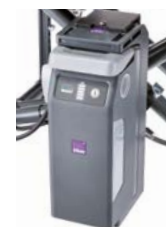
Vaste bevestiging van accu houder - Set 1