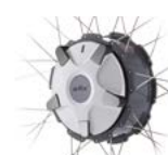
Bedieningshulp bij aan/afkoppelen