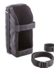
Transporttas en bevestiging