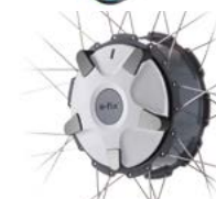
Bedieningshulp bij het activeren van de wielen