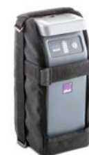
Reserve accu 6 Ah