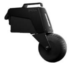
SMOOV one aandrijfunit