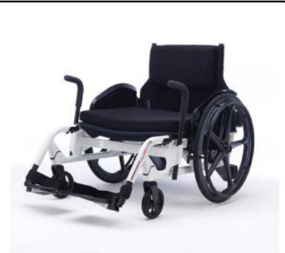
De getoonde productfoto kan afwijken van de standaardconfiguratie