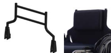
SMA2000, SMA2010 SMA2100