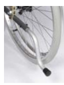
I440 / I441