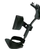
0520 / 0570