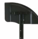
0738 / 0838