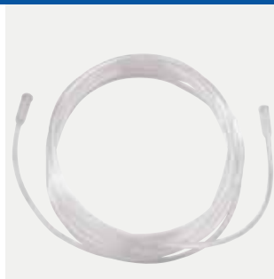
Tubo connettore 2,1m Codice 1513831 Tubo connettore 15,2m Codice M1522 Tubo connettore 4,5m Codice M4150 Tubo connettore 7,6m Codice M4250