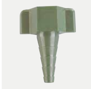
Connettore universale per serbatoio di ossigeno Codice M4610