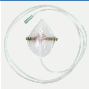
Maschera di ossigeno da adulto 2,1 m Codice M3210