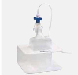
Supporto umidificatore Codice M1521