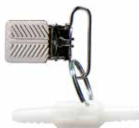
Connettore tubo girevole con clip Codice M1221