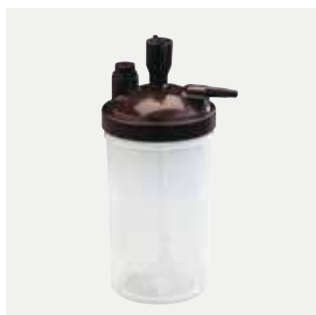
Umidificatore Platinum9 Codice 1509582