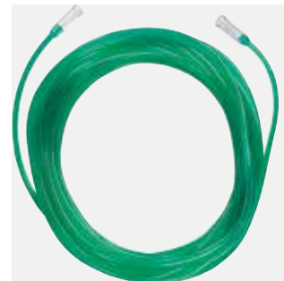
Tubo connettore 4,5 verde Codice M4150G