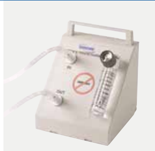
Flussometro pediatrico da 50 a 750 cc/min Codice 1514913