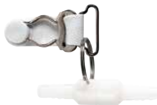
Clip girevole connettore tubo per pelli delicate Codice M1222