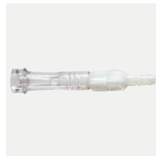
Connettore tubo girevole maschio femmina Codice M1225