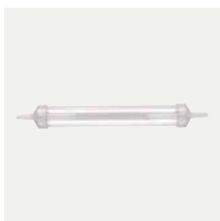
Connettore di condensa Codice M1523