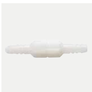
Connettore tubo girevole Codice M1220