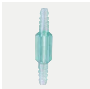
Connettore tubo Codice M4650