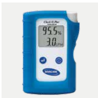
Analizzatore di ossigeno codice IRC450

Invacare Mecc San s.r.l. Via dei Pini, 62 - 36016 Thiene (VI) - Italy Tel.: +39 0445 380059 Fax: +39 0445 380034 e-mail: italia@invacare.com www.invacare.it