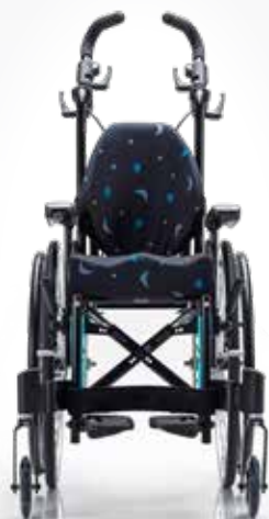
Action 3 Junior