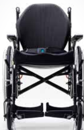
Action 3 NG