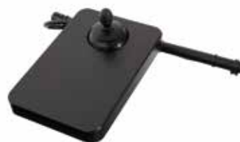
Joystick MEC (ASL130)

Lämplig att använda som hakstyrning då ytterhöljet står emot väta.