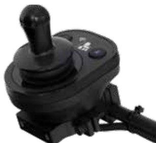
Joystick Compact (DLX-CR400)

För att ge bästa möjlighet till kontroll och oberoende så möjliggör REM400 och REM500 ett stort urval av alternativa styrningar som kan kombineras med TDX SP2 ULM .