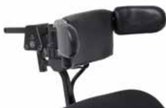
Huvudstyrning Sensorstyrd (ASL104)

Sensorer inbyggd i huvudstöd. Bluetoothintegrerat.