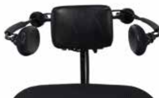
Huvudstyrning Sensorstyrd (ASL104P)

Sensorer inbyggd i huvudstöd. Bluetoothintegrerat.