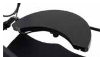
Sensorstyrning Four Switch (ASL106)

Justerbara sensorer inbyggd i huvudstöd. Bluetoothintegrerat.