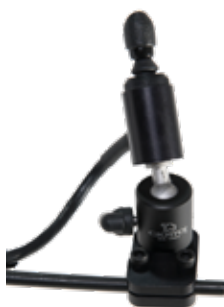
Joystick Extremity (ASL138)

Passar användare med nedsatt motorik och styrka.