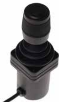
Joystick Compact single switch (ASL133)

Passar användare med nedsatt motorik och styrka.