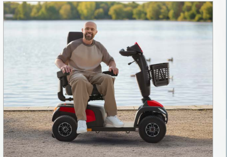
Asiento giratorio para transferencias más fáciles