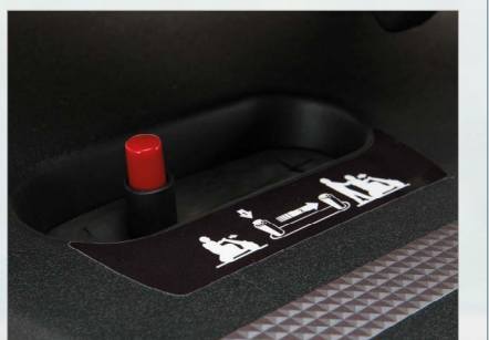
Palanca de desembrague en 2 tiempos que impide que el motor quede desembragado de forma involuntaria