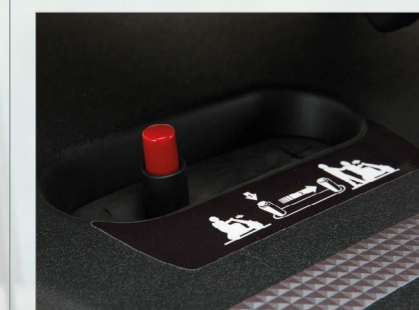
Palanca de desembrague en 2 tiempos que impide que el motor quede desembragado de forma involuntaria