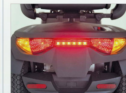
Iluminación de alta calidad