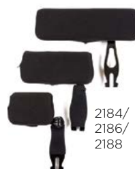
2184/ 2186/ 2188