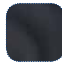
Black Dartex TR26