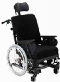
Dahlia 30° voor trippelen met een zithoogte van 32,5 cm.