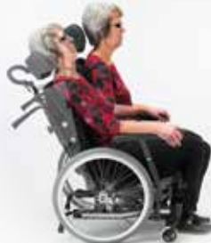
Dahlia 30° met zelfkanteling voor de cliënt die zelf actief van houding kan wisselen.