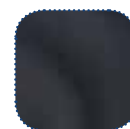
Dartex noir TR26