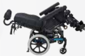
Dahlia 45° pour un transfert des points de pression optimal.