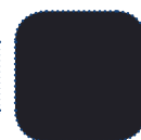
Spacer noir TR36

Rea, Rea Design et DSS Design sont des marques déposées par Invacare International. Le Rea Dahlia est conçu avec le DSS. Il fournit à l'utilisateur stabilité et sécurité lors de l'inclinaison d'assise ou de dossier.