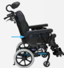
Le DSS avec point de pivot haut pour le dossier réduit les frictions au minimum pendant le réglage du dossier.