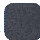
Plush noir TR35