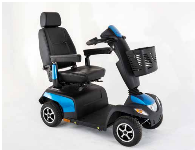
Fyrhjulig Orion METRO