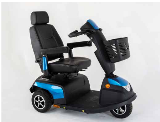
Trehjulig Orion METRO