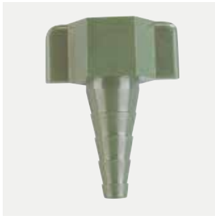
Universalkoppling för syretank