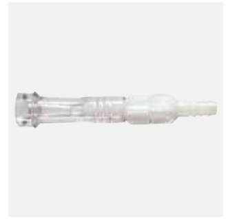
Roterande hane-hona slangkoppling