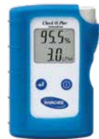
Check O 2 Plus Oxygenanalysatorn 3-i-1

Tillbehör för patienter som kräver lågt flöde. PreciseRx ger ett reglerbart flöde från 0,05 l/min till 0,75 l/min. Art nr: 1514913