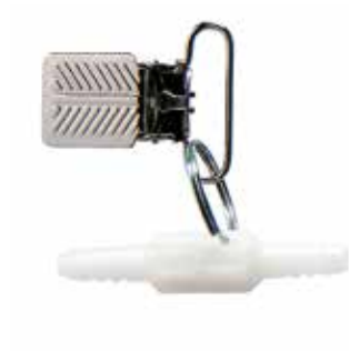
Roterande koppling med klämma