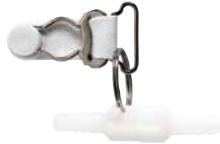
Roterande koppling med anpassad klämma för känslig hud