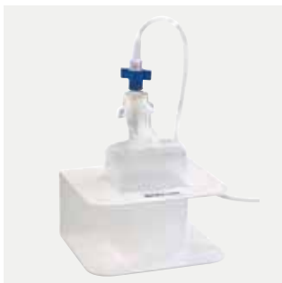
Hållare till Befuktare