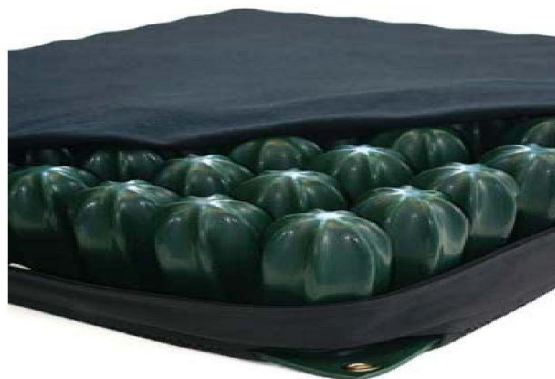
Cojín y cubierta

La distancia entre el punto más profundo de una persona sentada (generalmente las tuberosidades isquiáticas) y la base del cojín debe ser aproximadamente 2 cm.